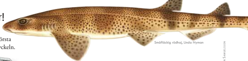
Småfläckig rödhaj, Linda Nyman

Upptäck svenska hajar, rockor, lansettfiskar, nejonögon, pirålar och sjöpingar i den första volymen om fiskar i bokverket Nationalnyckeln.