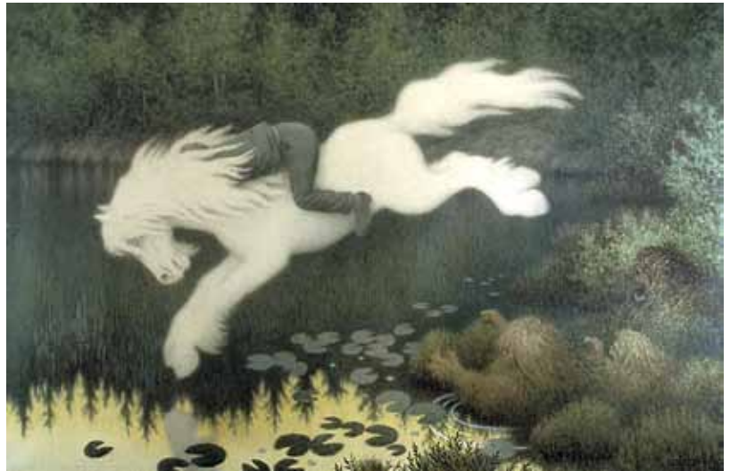
Theodor Kittelsen "Gutt på hvit hest".

Och här finns anledningen till att black metalmusiken har letat sig in i utställningen. Kittelsen har blivit något av en huskonstnär för några black metalband som gärna pryder sina skivomslag med hans skogsmiljöer och skildringar av digerdöden.